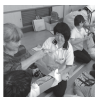
使用した物がある近所

9月13日に中浜小学校で開催された「中浜連合第3回防災訓練」に参加しました。救護班としての参加だけでなく、地震発生という設定での車いす体験や、応急処置の注意点と方法について説明を行い、地域の方々と一緒に実践しました。災害に備え、身近にある物を使用して応急処置が行えるよう災害時をイメージしながら説明を行いました。