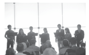
広場いっぱいに美しい歌声が響き渡りました

9月16日、こもれび広場に入院患者さんやご家族が大勢集まった中、男女7人構成の合唱集団「アンサンブル・ムジクス」によるアカペラが響き渡りました。日本の懐かしい歌が耳に心地よく、皆さん、真剣に耳を傾けていました。『あなたがたどこさ』や『上を向いて歩こう』はテンポ良く、頭を振ったり手でリズムをとる人が大勢いました。歌が終わる