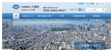
大道会総合サイト

7月30日、『大道会総合サイト』と『看護師採用サイト』の2つのホームページをリニューアルしました。スマートフォンでも快適に閲覧できる「レスポンシブデザイン」を採用し、当法人の取り組みや、看護師・その他職種の採用ページの情報を大幅に追加しました。年内には大道会の各病院・施設の8サイトがリニューアルされる予定です。この機会に、ぜひ大道会ホームページ( http://www.omichikai.or.jp/ )をご覧ください。