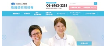
看護師採用サイト