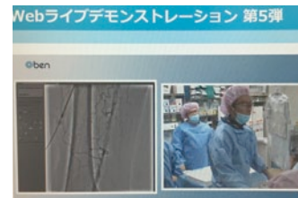
Webライブデモンストレーションの様子